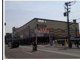
ライフ(スーパー) 徒歩4分(約320m)