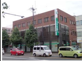
りそな銀行 徒歩5分(約390m)