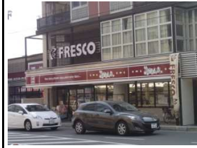
フレスコ(スーパー) 徒歩3分(約240m)