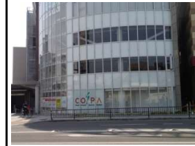
KOSUPA(スポーツクラブ) 徒歩5分(約370m)