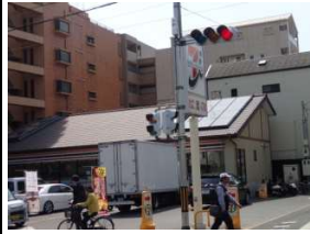
セブンイレブン 徒歩1分(約70m)