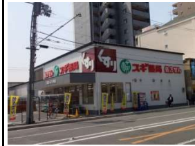
スギ薬局 徒歩4分(約280m)